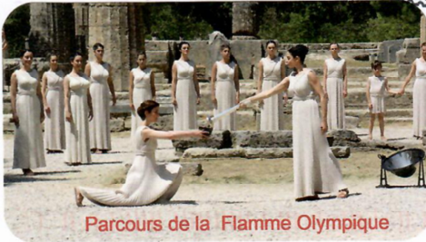
Parcours de la Flamme Olympique

Station Nummer 2 in Übersee: La Reunion am 12. Juni 2024