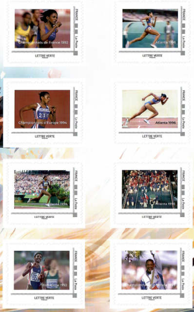
Das imposante Folienblatt im Format A4 mit acht Motiven aus Pécé's Athletenleben zum Inlandstarif (Lettre Verte).